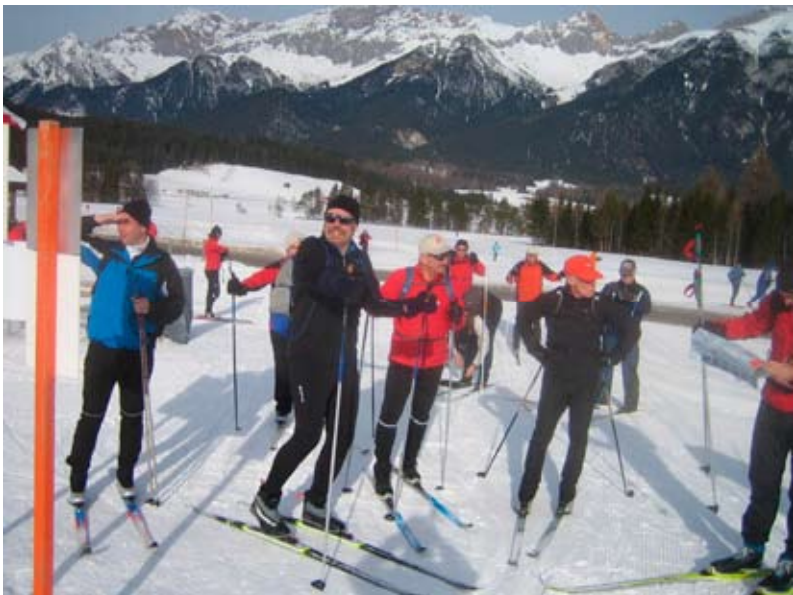
In Leutasch vor dem ersten Anstieg in Richtung Seefeld

Die Olympiaregion Seefeld, zweimaliger Austragungsort für die nordischen Wettbewerbe bei den Olympischen Winterspielen 1964 und 1976 gilt als Mekka des Ski-Langlaufs. Fast die gesamte Weltelite hat hier schon trainiert und Wettkämpfe bestritten. Da dürfen wir natürlich nicht fehlen. Man findet im Gebiet von Seefeld und Leutasch perfekt präparierte Loipen von insgesamt 279 km (klassisch und Skating) in allen Schwierigkeitsgraden für Anfänger und Profis gleichermaßen.