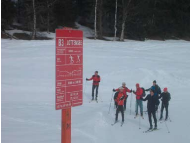
Auf der mittel-schweren Lottensee-Loipe nahe dem Ferienheim Wildmoos