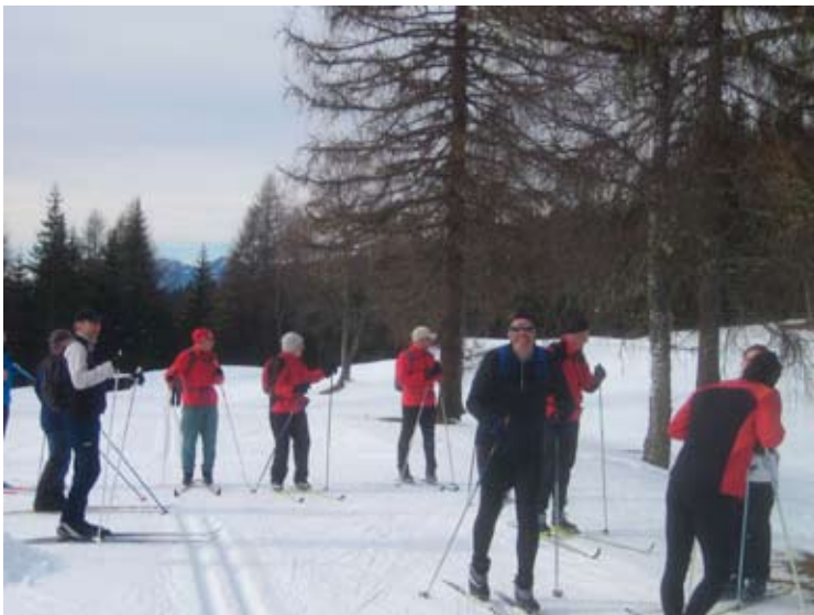
Am Ende der schweren Interpalpen-Loipe (C8) und Einstieg in die Lottensee-Loipe