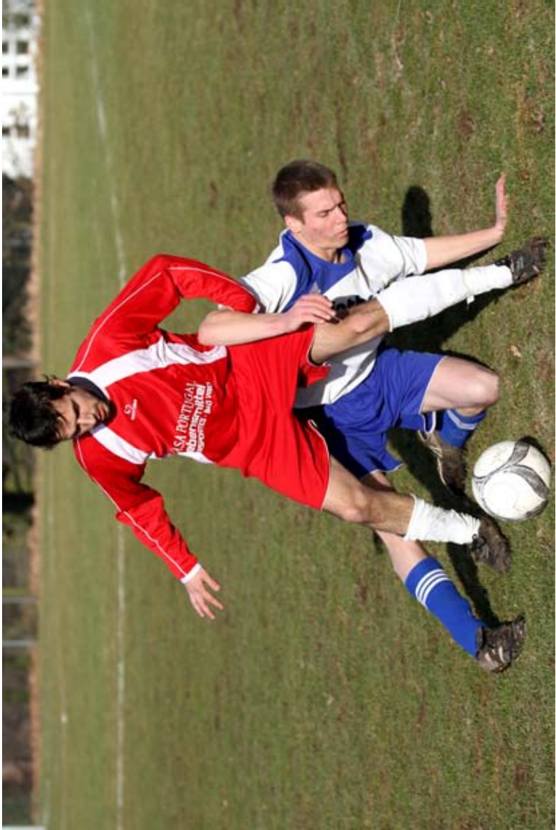
„Der falsche Daniel“ Nr.26 (Auflösung S.22)