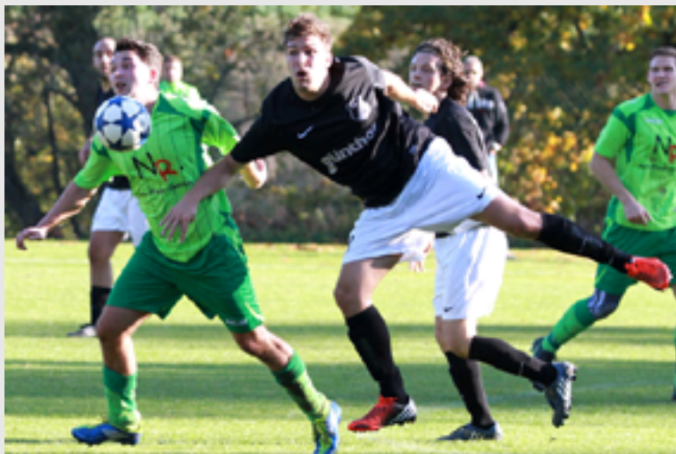
FSV Schlierbach Kalender 2013. Fotos & Design von Ottmar Walter